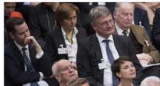
Abschreckende Äußerungen... (siehe unten)

Diese hasserfüllte Frust-Truppe soll eine Alternative sein? Vielleicht für Arschlöcher. Aber nicht für Deutschland. #Bundesversammlung